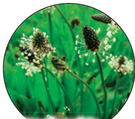
Plantago lanceolata Spitzwegerich babka lancetowata Ribwort plantain