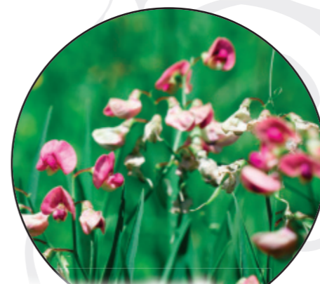
Lathyrus pratensis Wiesen-Platterbse groszek żółty Mouse-ear chickweed