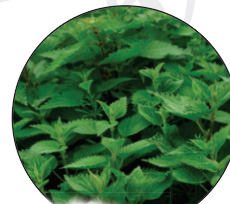
Urtica dioica Große Brennessel pokrzywa Common sorrel