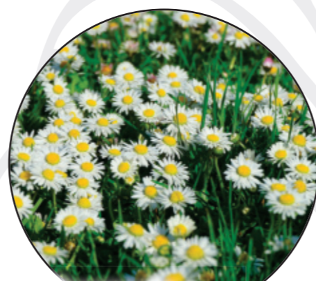
Bellis perennis Gänseblümchen stokrotka pospolita Common daisy