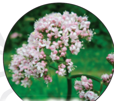
Valeriana officinalis Echter Baldrian kozłek lekarski Common daisy