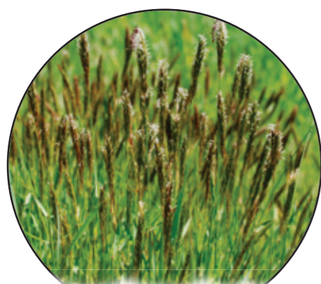
Anthoxanthum odoratum Gewöhnliches Ruchgras tomka wonna Sweet vernal grass

Auf dieser Wiese wachsen mindestens 20 verschiedene Pflanzenfamilien. Darunter sind folgende Arten: