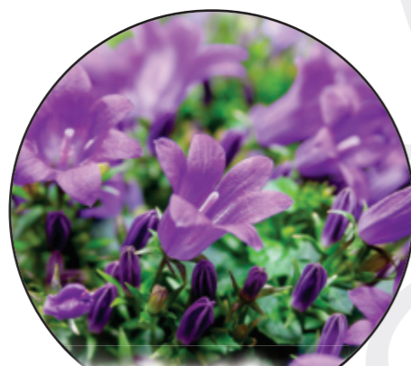
Campanula patula Wiesenglockenblume dzwonek rozpierschty Spreading bellflower