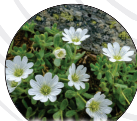
Cerastium holosteoides Gewöhnliches Hornkraut rogownica pospolita Mouse-ear chickweed