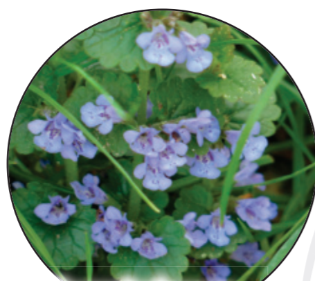
Glechoma hederacea Gundermann bluszczuk kurdybanek Ground-ivy