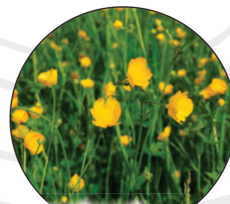
Ranunculus acris Scharfer Hahnenfuß jaskier ostrzy Meadow buttercup