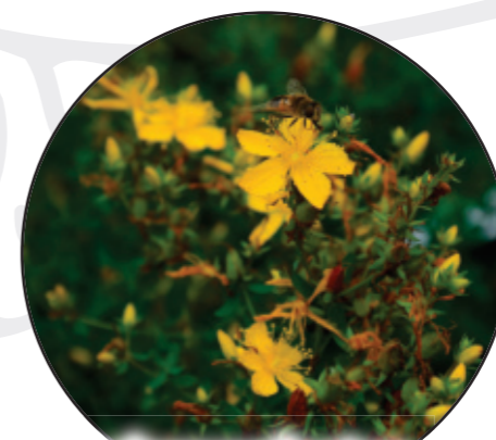
Hypericum perforatum Johanniskraut dziurawiec zwyczajny Meadow buttercup