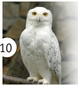
10 sowa śnieżna