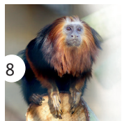
8 marmozeta złotogłowa