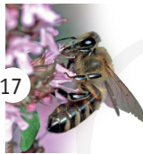
17 pszczoła miodna