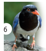
6 kitta czerwono-nodzioba