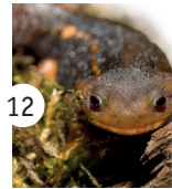
12 traszka krokodylowa