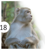
18 makak rezus