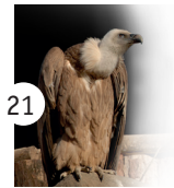
21 sęp płowy