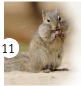
11 wiewiórka skalna