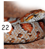
22 wąż zbożowy