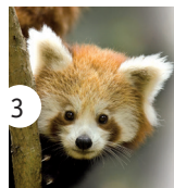
3 panda czerwona