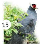
15 uszak siwy