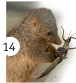
14 mangusta przegowana