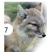
7 lis stepowy