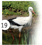
19 bocian biały