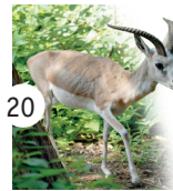
20 gazela dżejran