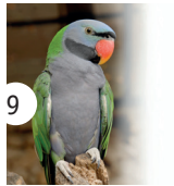
9 aleksandretta chińska