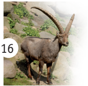
16 koziorożec alpejski