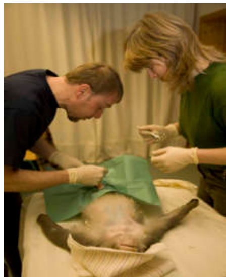
Aufgrund permanenten Stresses in der Rhesusaffen-gruppe wurden sechs Tiere kastriert.