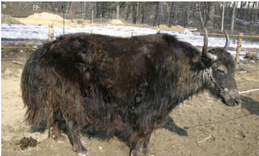
Yak Jana mit deutlichen Hautverdickungen und Haarlosigkeit im Kopfbereich.

Bei den Seeadlern spielen chronische Bleivergiftungen eine Rolle. Diese können