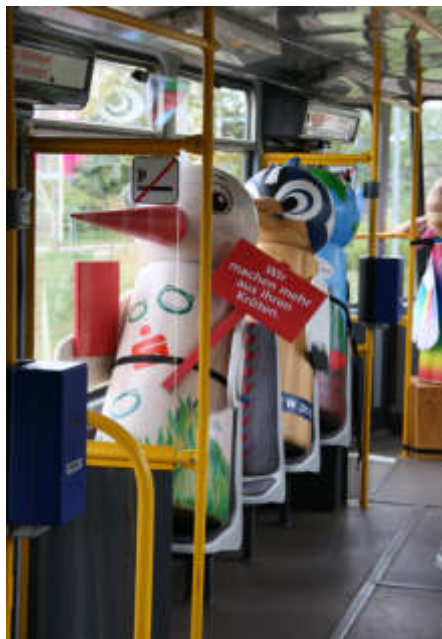
Die Görlitzer Verkehrsbetriebe machten es möglich - eine Sonderfahrt mit der Straßenbahn für die Storchis.