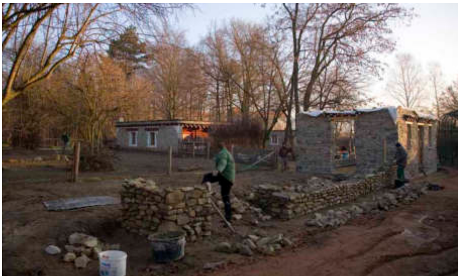
Kamelhaus im Bau. Das fertige Gebäude ist wieder aus Naturstein und Holz gefertigt und einem Gebäude in der Region um Dartsedo nachempfunden.