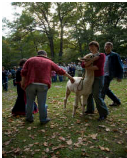
Zur Wahl des schönsten Kamels reisten die Bewerber aus allen Teilen Sachsens an.