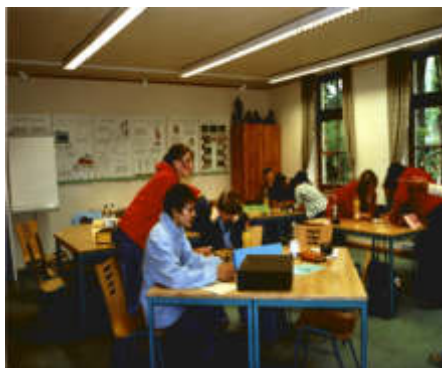
Die Bioolympiade der Klassenstufen 7 des Regional- schulamtsbezirks Bautzen fand bei uns statt.