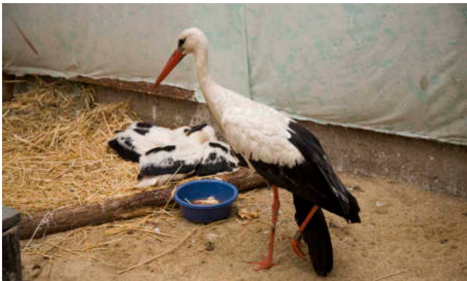
Mit zu den häufigsten Patienten unter den Wildtieren zählen die Weißstörche.