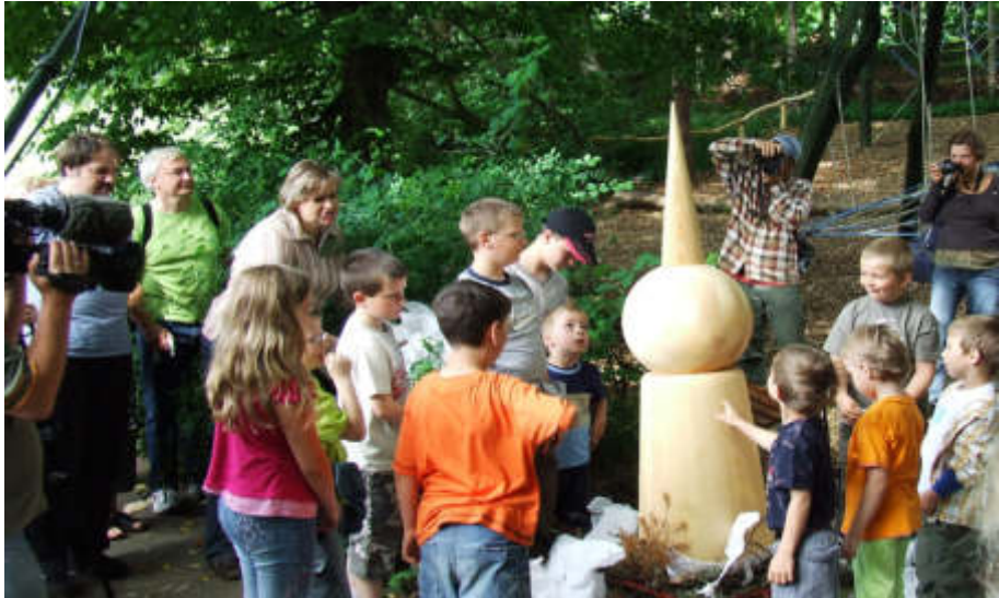
Der Freundeskreis enthüllt seinen Storchi, den Schüler der Mittelschule Rauschwalde gestalteten.