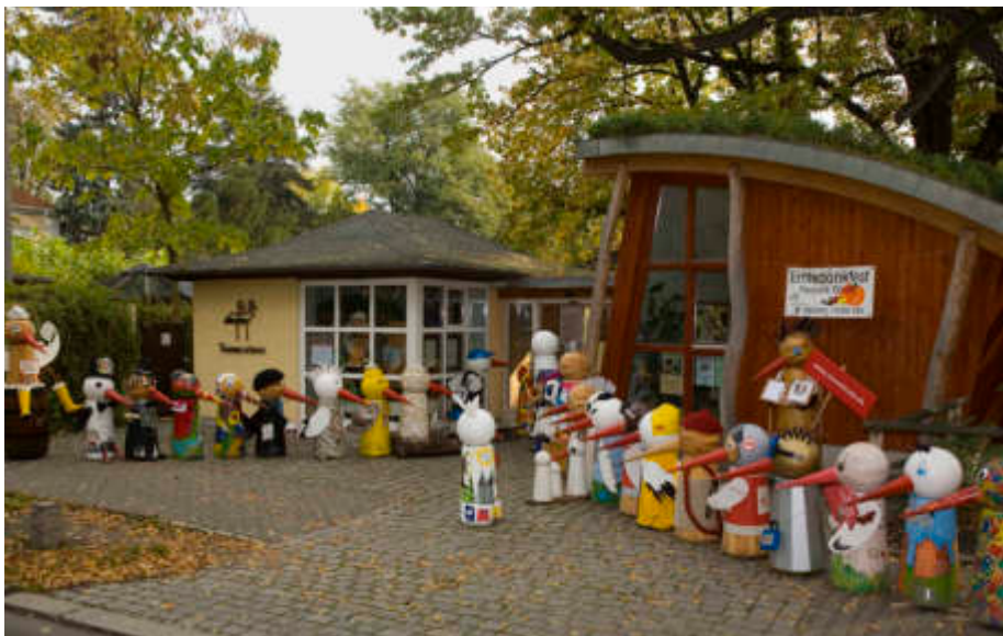
Schräge Vögel vor dem Kassengebäude - fertig gestaltet und (aus)flugbereit.