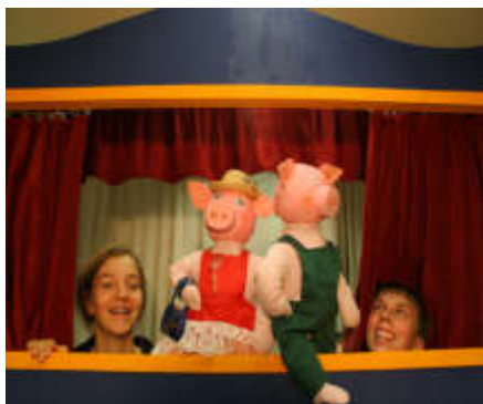
Zur Langen Nacht der Museen führten Schüler der Mit- telschule Innenstadt die „Konferenz der Tiere“ auf.