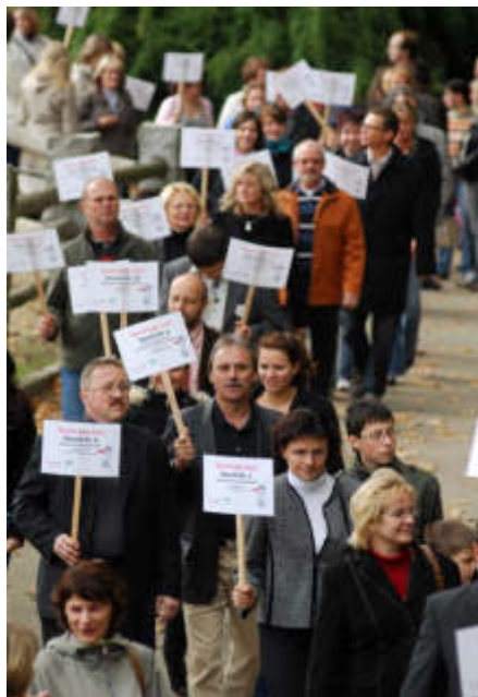
Einmarsch der Storchianer zum Finale am Erntedankfest im Oktober.