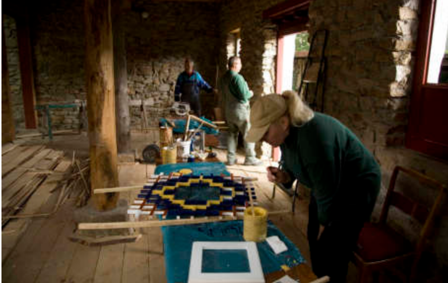
Mitarbeiter gestalten Fenster und Türen des Kamelhauses farbig nach dem tibetischen Original.