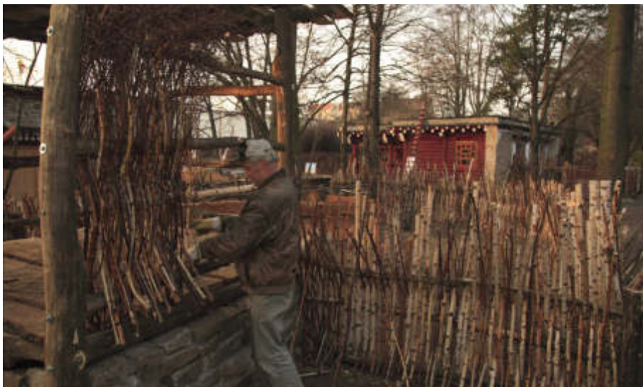
An der nach tibetischem Vorbild nachgebauten Außentoilette befestigt ein Mitarbeiter Weidenäste als Sichtschutz.