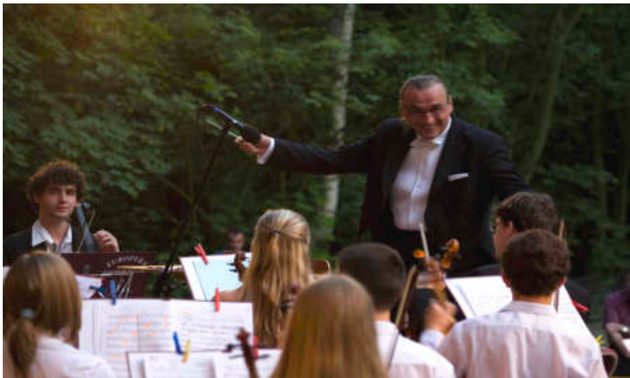
Der Tierpark als Kulturbühne - das trinationale EUROPERA Jugendorchester unter Leitung von Theater-Kapellmeister Miloš Krejčí begeisterte bei herrlichem Sommerwetter die Gäste des Benefizkonzerts zu Gunsten des Tierparks.