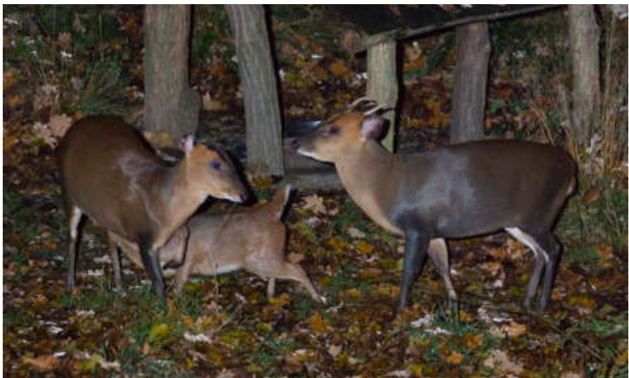
Weiblicher Nachwuchs bei den Chinesischen Muntjaks, der mittlerweile im Zoo Basel lebt.