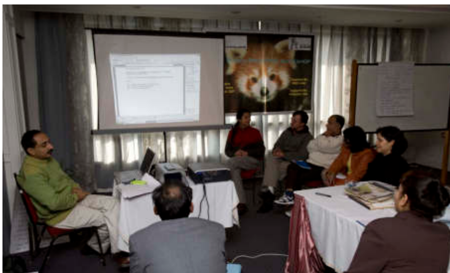
Am pre PHVA (Population and Habitat Viability Assessment) Meeting „Red Panda“ in Gangtok, Indien im Februar nahmen Wissenschaftler, Zoomitarbeiter, Naturschützer und Behördenvertreter aus Europa und Asien teil.