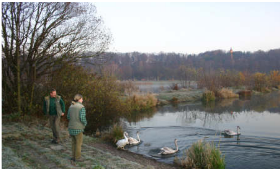
Freilassung von sechs verlassenen Schwanenküken, die von Tierpark-Mitarbeitern großgezogen wurden.