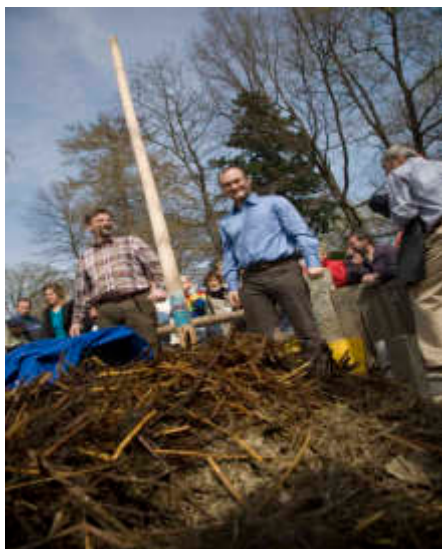
Polnische und deutsche Bürgermeister machten beim Mistkarrenrennen den Sieg unter sich aus.