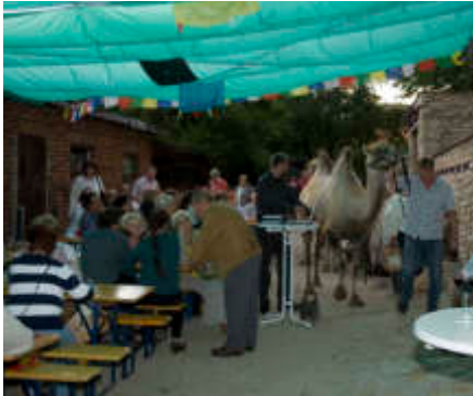
Zum Sponsorenfest luden wir vor das gerade eingeweichte Kamelgehege.