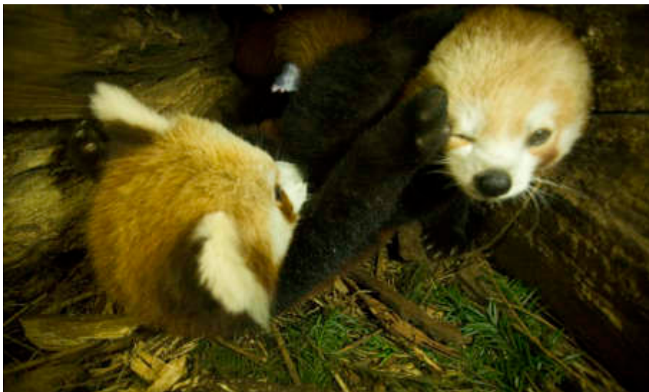
Ein Blick in die Kinderstube der Roten Pandas. Weltweit erstmalig sind die Aufnahmen aus der Wurfhöhle, mit denen das Spielverhalten der Jungtiere erforscht werden soll.

dem WWF Deutschland mitfinanziert wird. Diese Studie soll zumindest für die Region die enormen Wissenslücken über Populationsgröße, Biologie und Bedrohungsursachen schließen helfen. Da bei diesem Workshop auch festgestellt wurde, dass selbst grundlegende Daten zur Biologie und zum Verhalten des Roten Panda fehlen, untersuchten wir die Jugendentwicklung und mütterliche Fürsorge der Art. Dies war möglich, weil das Weibchen des Görlitzer Zuchtpaares tolerierte, dass hinter der natürlichen Wurfhöhle (ein hohler Baumstamm) eine Überwachungskamera installiert wurde. So konnten erstmalig lückenlose Aufnahmen vom Verhalten eines Jungtieres von der Geburt bis zum Verlassen der Höhle aufgezeichnet wer-