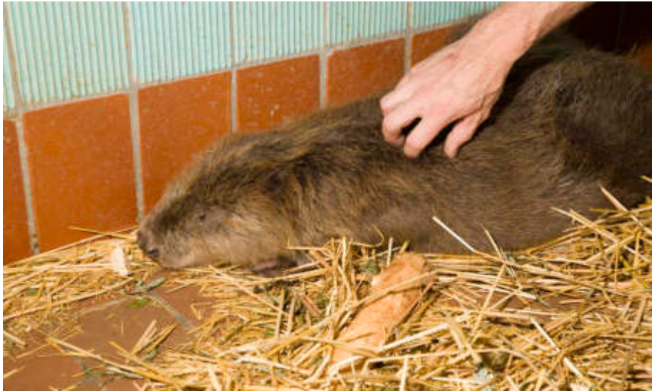
Ein seltener Gast in der Wildtierauffangstation war ein Biber, der mit einer geringfügigen Verletzung bei uns eingeliefert wurde.