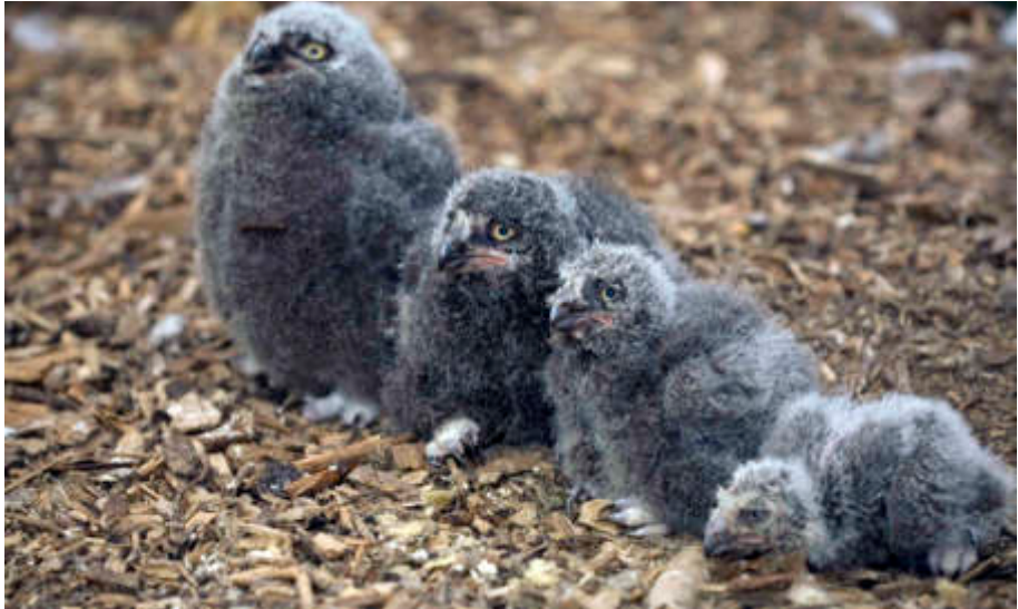
Nachwuchs bei den Schnee-Eulen. Sie schlüpfen im Abstand von zwei Tagen, was die unterschiedliche Größe erklärt. Oftmals setzt sich der Erstgeborene beim Fressen gegen seine jüngeren Geschwister durch.