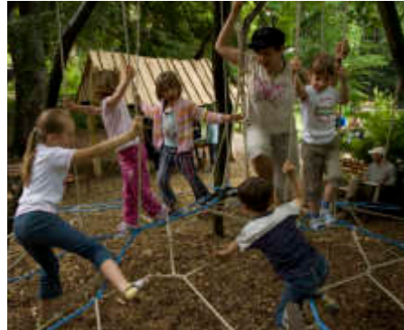
Das neu gebaute Spinnenspiel wurde Pfingsten von unseren kleinen Besuchern getestet und für gut befunden.