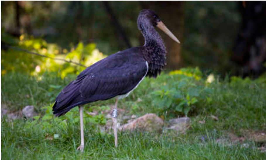
Überraschender Besuch - ein Schwarzstorch auf der Kranichanlage.

Zu weiteren Umweltschutzprojekten gehörte die Pflege einer nahe gelegenen Wiese mit dem darauf vorkommenden Dunklen Wiesenknopfläuling ( Maculinea nausithous ). Im Berichtsjahr arbeiteten wir außerdem im Verbundprojekt Elch mit, beteiligten uns an der Fischotter-Wiederansiedlung in den Niederlanden durch die Übergabe eines bei uns gezüchteten Tieres und erfassten den Weißstorch-Brutbestand in der Region.